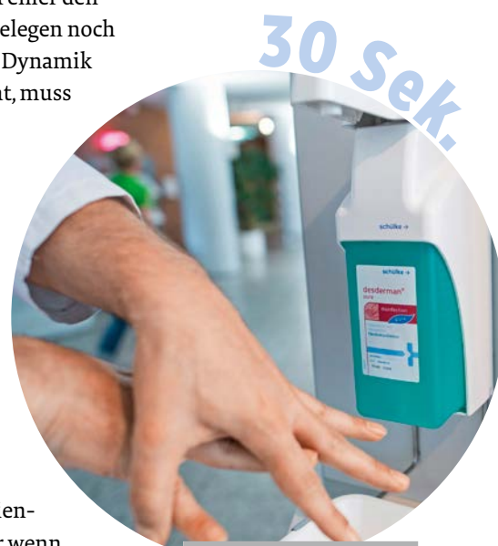
Hände sollen konsequent über 30 Sekunden desinfiziert werden, auch Fingerspitzen, Daumen und Fingerzwischenräume.