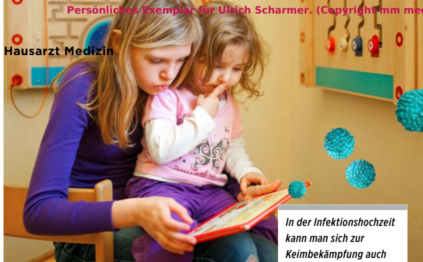
In der Infektionshochzeit kann man sich zur Keimbekämpfung auch Einmalspielzeug zulegen.